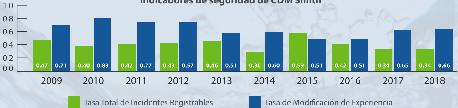
Indicadores de seguridad de CDM Smith

Año 2019: Reconocimiento por excelencia preventiva y salud ocupacional (Asociación Chilena de Seguridad, ACHS).